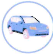
des véhicules hors installations professionnelles