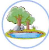
des étangs et plans d'eau