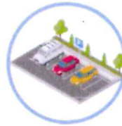
des voiries et parkings