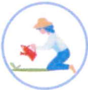
des jardins d'agrément