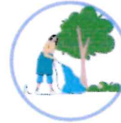
des potagers, vergers et arbres de moins d'un an de plantation