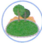
des pelouses et espaces verts publics ou privés