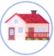
des terrasses, cours et façades