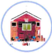
des hangars et locaux de stockage