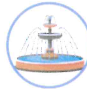
des fontaines d'eau alimentées par le réseau d'eau potable, sans recyclage d'eau